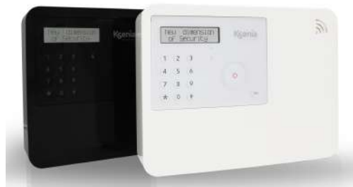
lares 4.0 wls 96