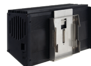
Kit de fixation rail DIN pour module 14M 3 DRB9590 (1)