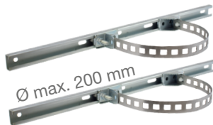
Kit de fixation sur poteau 2 PSWU-600POST (1)