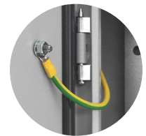
Cordon de mise à la terre 6mm 2 /160mm 6 PSWU-160EW