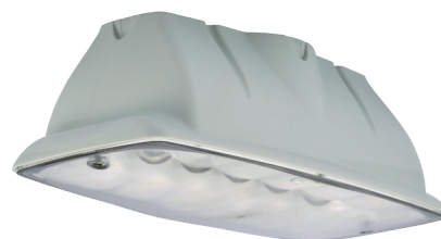
Accessoire boîtier fixation plafonnier Code: L9008-88